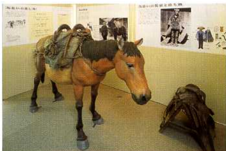
中馬展示コーナー

館内には中馬馬子唄が流れ、模型やパネルなどによって平谷宿の歴史や馬追い衆の生活の様子を知ることができます。